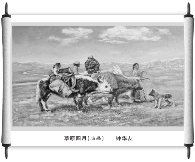
草原四月(油画) 钟华友