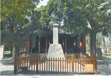
本栏图片为世界文化遗产登封“天地之中”历史建筑群

漫步登封“天地之中”历史建筑群,走近这些体现“天地之中”古老宇宙观的天文建筑、教育建筑、宗教建筑,你会真实地感受到中华独特的宇宙观和审美观,体会到“中”“中土”“中央”,以郑州地区为核心