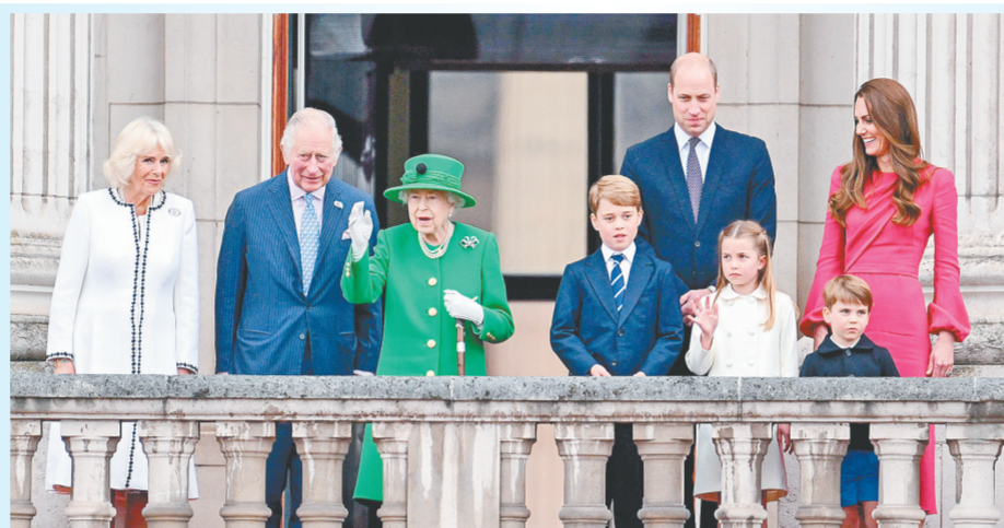
6月5日，英国女王伊丽莎白二世(左三)和家人在伦敦白金汉宫的阳台上向民众挥手。

英国国防部5日宣布，在与美国方面密切协作下，英方向乌克兰提供射程可达80公里的多管火箭炮系统。 同一天，在俄罗斯媒体播发的专访中，俄总统弗拉基米尔·普京批评西方对乌克兰输送武器的唯一目的就是“延长冲突”。 英国国防大臣·华莱士5日在声明中说，随着俄罗斯“战术不断变化”，英方向乌克兰提供的支援也将调整，“高性能”的M270型多管火箭炮系统将增强乌克兰“保护自我”的能力，乌方军人将在英国接受相关培训。 据法新社报道，英方迄今已向乌方提供价值约7.5亿英镑的军事援助，包括防空系统、反坦克导弹和装甲车，并且向乌方人员提供相应培训。 M270型多管火箭炮系统由美国研制，是北大西洋公约组织制式武器之一，发射管口径227毫米，总计12个发射管，所用制导火箭弹射程最远可达80公里。一些媒体先前报道，英军正在升级部分M270型火箭炮系统，改造后射程可达150公里。 乌克兰方面多次呼吁西方国家提供射程更远的武器，如M270型火箭炮系统和使用越野卡车底盘的M142型高机动性火箭炮系统。 5月31日，美国总统约瑟夫·拜登批准最新一批美对乌武器援助，包括M142型火箭炮系统，但同时重申美国和中国不希望直接介入俄乌冲突。美方官员说，这次搭配的弹药是中程火箭弹，射程80公里。拜登30日说，美国不会向乌克兰提供“能够打到俄罗斯境内”的火箭炮。多家媒体报道，美方获得乌方不打击俄境内目标的保证后作出最新军援决定。 俄方多次批评美国及其西方盟友向乌克兰输送大批武器，且越来越先进、射程越来越远，利用乌克兰对俄罗斯发起“代理人战争”。 在俄罗斯一家电视台5日播出的采访中，普京再次批评西方对乌克兰提供武器的做法。普京指出，西方“只有一个目的”，就是“尽可能延长俄乌冲突”。 普京强调，西方提供军援不可能改变军事局势，只能“弥补基辅方面的军事装备损失”。 他说，如果乌方获得射程更远的武器，俄方“将做出相应的结论并打击之前没有打击过的目标”。 新华社特稿