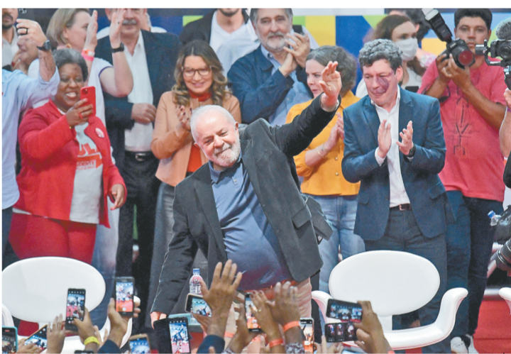
5月9日，在巴西贝洛奥里藏特，总统竞选人、前总统路易斯·伊纳西奥·卢拉·达席尔瓦参加活动。新华社发

巴西总统竞选人、前总统路易斯·伊纳西奥·卢拉·达席尔瓦5日确诊感染新冠病毒，接下来几天将接受隔离。 现年76岁的卢拉当天在社交媒体推特证实，他和新婚妻子亚妮娅的新冠核酸检测结果均呈阳性。但两人身体状况良好，卢拉没有症状，亚妮娅症状轻微。 巴西定于10月2日举行总统选举第一轮投票。如果无人得票率超过50%而直接胜出，排名前两位的候选人将在10月30日第二轮投票中对决。卢拉5月7日宣布参选总统，目前民意支持率领先。同在5月，他与55岁的社会学家亚妮娅结婚。 总统竞选活动定于8月正式开始。近期民调显示，最终对决可能在卢拉和寻求连任的现任总统雅伊尔·博索纳罗之间展开，卢拉的优势正在扩大。巴西福利亚民意调查公司调查发现，卢拉支持率为48%，博索纳罗为27%。 卢拉1980年创立劳工党，2003年至2010年担任两届总统。在他执政期间，巴西经济迅速增长，重回世界经济十强行列。巴西司法机关2014年启动“洗车行动”反腐调查后，卢拉因涉嫌受贿于2018年4月入狱，但一直坚称清白，2019年11月获释。2021年3月，巴西联邦最高法院法官埃德松·法欣裁决，卢拉此前因涉嫌贪腐所获的所有判决“均无效”。同年4月，该法院表决维持这一裁决，这意味着卢拉恢复“自由身”。今年1月，一名联邦刑事法官决定对卢拉受贿案予以结案，扫除了卢拉参选总统的主要障碍。 新华社特稿