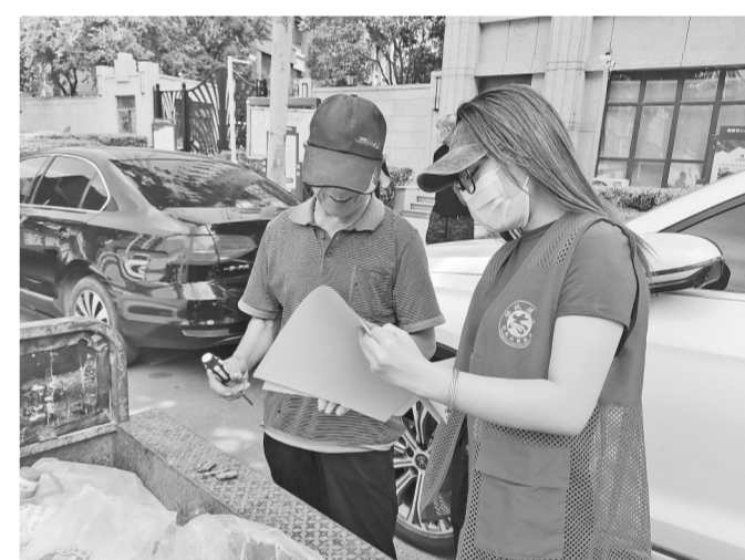
为提高辖区老年人防范诈骗的安全意识,6月6日,管城区紫荆山南路街道办事处西堡社区党群服务中心组织志愿者开展“警惕诈骗,守护好我们的钱袋子”宣传活动。