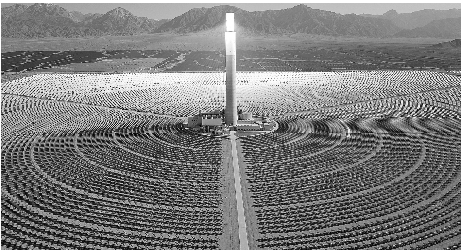
这是6月8日在海西蒙古族藏族自治州德令哈市光伏(光热)产业园拍摄的青海中控德令哈50兆瓦光热电站(无人机照片)。今年以来,地处柴达木盆地的青海海西蒙古族藏族自治州在已建成万千瓦级新能源产业集群的基础上,依托域内丰富的光照、风能以及荒漠、戈壁等资源,新开工建设中广核200万千瓦光伏光热项目、青豫直流二期20万千瓦光热项目等5个新能源项目。目前各项建设工作正在有序推进。