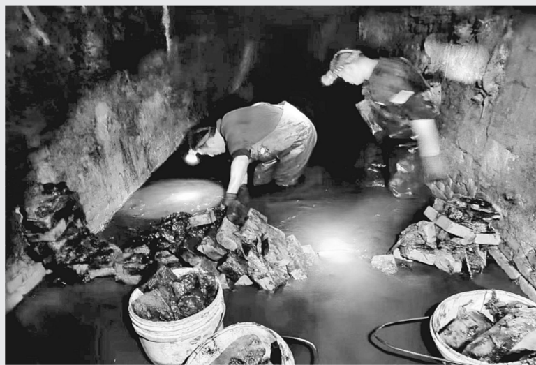
工作人员疏挖地下管道

本报讯(记者 党贺喜 通讯员 沈毅秀 胡漫漫)为确保城区安全度汛,金水区以城市精细化管理为抓手,早早做足准备,筑牢坚强屏障。金水区城管局把防汛关口前移,对辖区主次干道进行了雷达