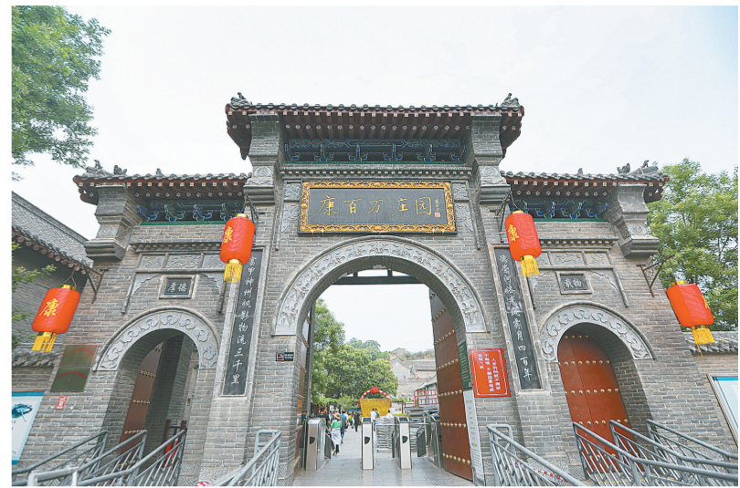
康百万庄园争创国家5A级景区

本报讯(记者 成燕 通讯员 董栋 王银辉 文/图)建设北部沿黄文化带,打造人文体验区;建设中部宋文化带,打造生态遗址游览区;建设南部自然景观带,打造山水观光区……记者从14日举行的巩义市2022年文旅工作会议获悉,今年,该市将构筑“三带三区”新格局,全力打造双槐树国家考古遗址公园、“寻访宋朝之旅”等一批黄河文化地标项目及高品位旅游度假区等一批具有引领性的文旅项目,让河洛文化、宋文化、杜甫文化更具吸引力和感召力。