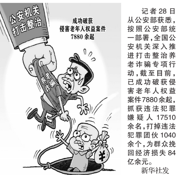
记者28日从公安部获悉,按照公安部统一部署,全国公安机关深入推进打击整治养老诈骗专项行动,截至目前,已成功破获侵害老年人权益案件7880余起,打掉违法犯罪嫌疑人17510余名,为群众办实事1040余个,为群众挽回经济损失84亿余元。

这是今年以来我国第二次下调汽油、柴油价格。国家发展改革委有关负责人说,中石油、中石化、中海油三大公司及其他原油加工企业要做好成品油生产和调运,确保市场稳定供应,严格执行国家价格政策。各地相关部门要加大市场监督管理力度,严厉查处不执行国家价格政策的行为,维护正常市场秩序。