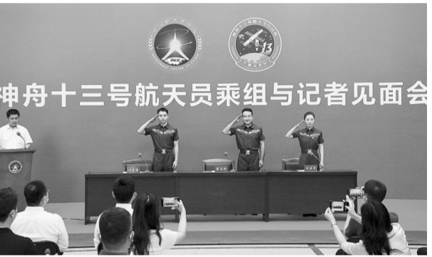
6月28日下午,神舟十三号航天员乘组在北京航天城与媒体和公众正式见面,这是他们天外归来74天后的首次公开亮相。目前,航天员身心状态良好,在完成恢复期各项工作、进行恢复健康评估总结后,3名航天员将转入正常训练工作。

免去张晓明的国务院港澳事务办公室分管日常工作的副主任职务;免去李书磊的国家行政学院分管日常工作的副院长职务;免去甄占民的国家行政学院副院长职务。