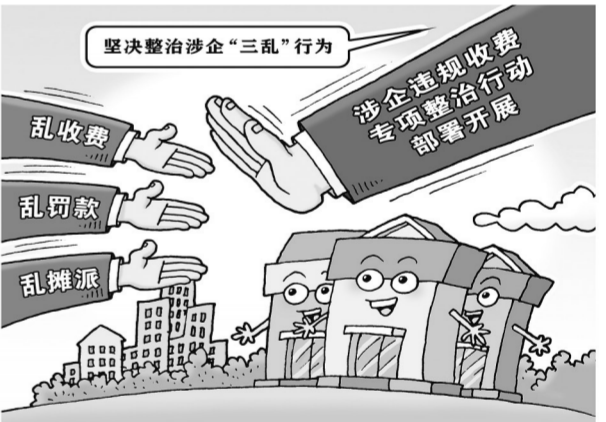
涉企违规收费专项整治行动全国电视电话会议6月28日在京召开。工信部副部长徐晓兰表示,将开展涉企违规收费专项整治行动,全面排查交通物流、水电气暖、地方财经、金融、行业协会商会等领域涉企违规收费问题,坚决整治涉企“三乱”行为。