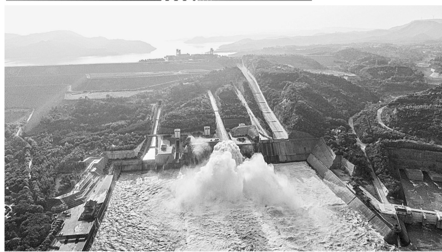
这两张图片分别是27日(左)、28日(右)拍摄的位于河南省济源市的小浪底水利枢纽工程调水调沙现场。2022年汛前黄河调水调沙正在有序进行,27日至28日,本次调水调沙达到最大下泄流量4500立方米每秒量级。据了解,黄河2022年汛前调水调沙于6月19日开始,将历时20天左右。