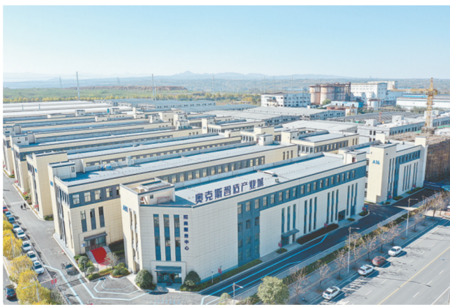
奥克斯小微企业园