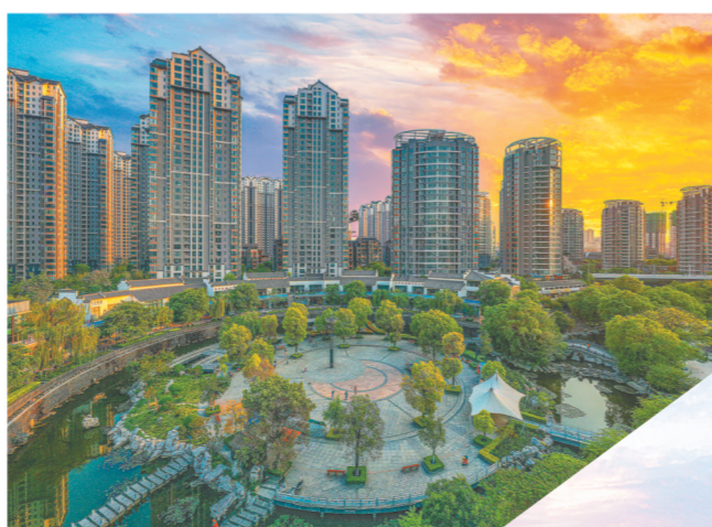
城市建设日新月异