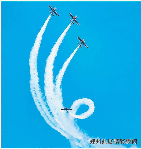
郑州航空精彩瞬间

夜间经济热闹有序,道路交通安全顺畅,街角游园花繁叶茂,老旧小区干净整洁……夏日,走在上街区的街头巷尾,总能听到纳凉的人们讲述着这座小新的变化。近年来,上街区深入贯彻新发展理念,主动服务和融入新发展格局,锚定“两个高地、四个美丽”奋斗目标,着力打造全省老工业城区转型升级先行区、全国领先的通航产业综合示范区、“一带一路”物流枢纽重要节点、现代宜居的公园城区,奋力谱写美丽上街现代化建设新篇章,书写经济社会高质量发展答卷。