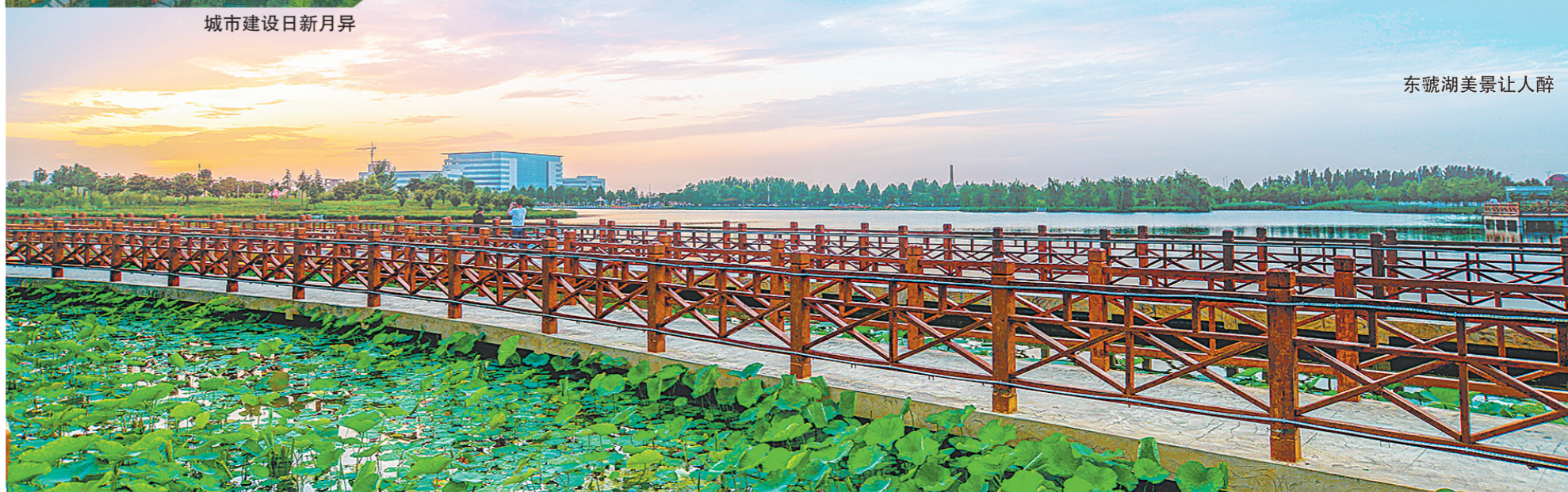
东湖水美景让人醉

相信美丽、温暖的上街,未来会带给人们更多的惊喜和感动……