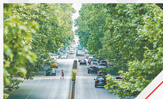
嵩山路法桐之美