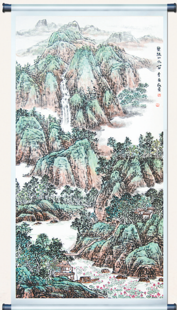
碧绿山水图 李惠敏