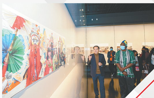
文化碰撞