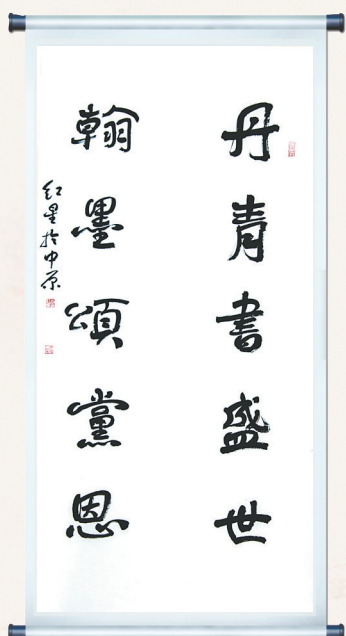
丹青书盛世 翰墨颂党恩 尚红星