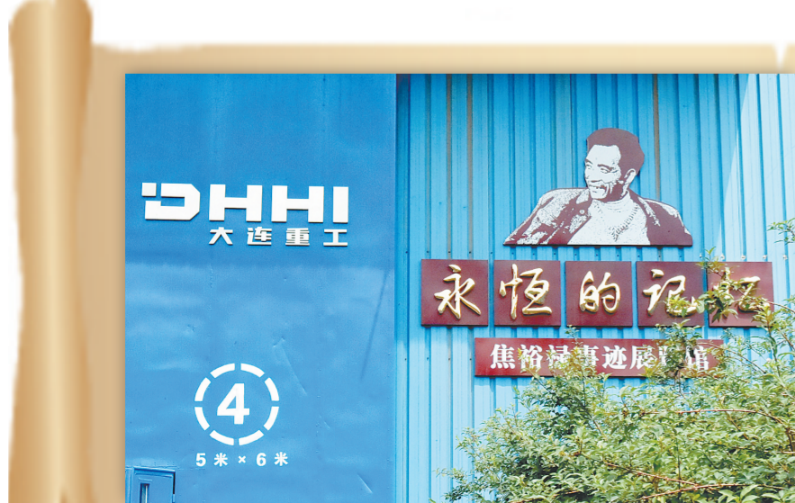
位于大连重工园区内的焦裕禄事迹展览馆

2014年7月，《大连日报》重新发现、再次刊发这组版画并配发相关报道，画作与背后的故事才为更多人所了解。如今，这组版画已成为大连博物馆、大连重工焦裕禄事迹展览馆中相关展览的核心内容。