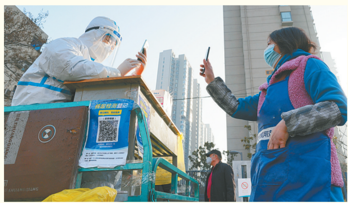
数字化让防疫更有“数”