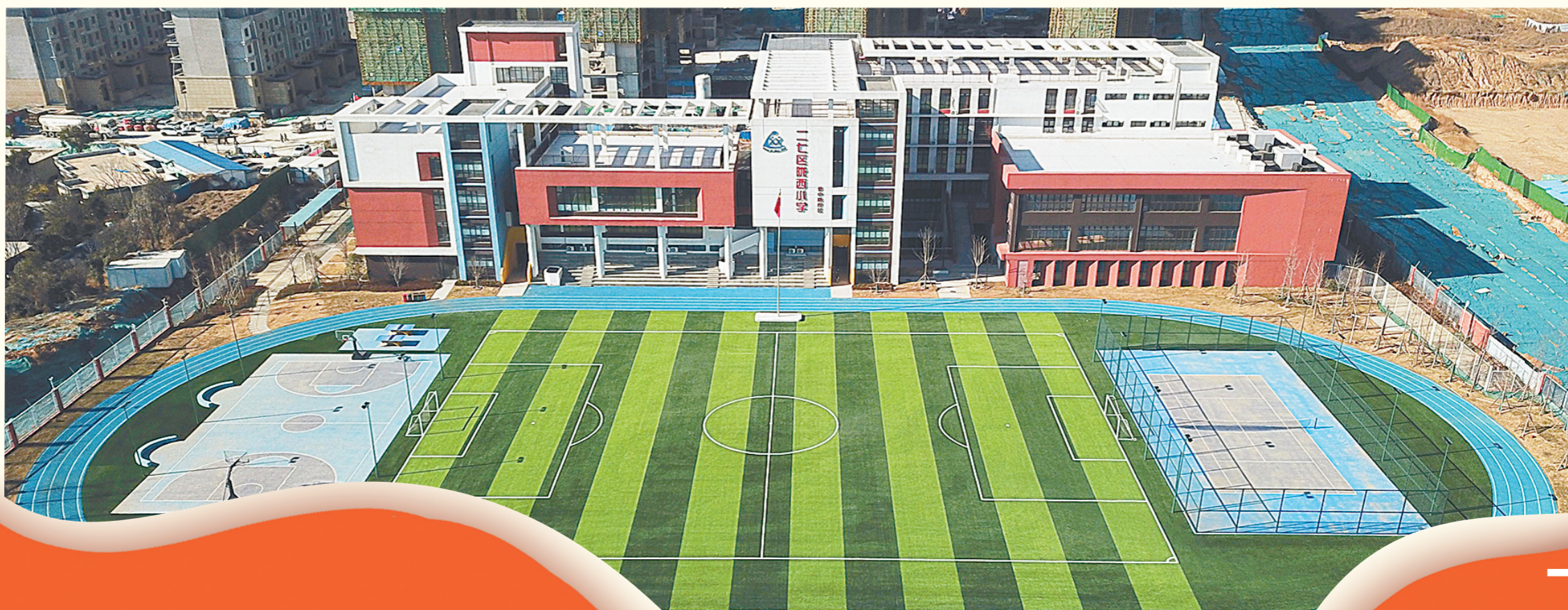
全面开展教育战线“三标”活动,全力打造美好教育

春风浩荡满目新,砥砺奋进争佳绩。知责履责、知重负重、感恩奋进的郑州,牢记嘱托、鼓足干劲、以更加强烈的责任感、紧迫感、使命感,更加担当作为的奋斗精神,推动郑州国家中心城市现代化建设迈出更大步伐、取得更大成效,不负时代赋予的历史重任,努力向党和人民交出经济社会发展的满意答卷。