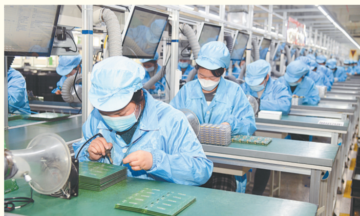
发力制造业,拉高标杆谋发展

市委始终践行以人民为中心的发展思想,明确提出了今年发展的方向路径,以“当好国家队、提升国际化、引领现代化河南建设”为总目标,以“整体工作争先进成高原,重点工作创一流起高峰”为总要求,全面开展“工作有标杆、落实有标准、突破有标志”“三标”活动,深入推进“十大战略”行动,全力争取“一年起势、三年成势、五年胜势”,确保“发展上得去、社会稳得住、城市管得好”,努力为全国乃至全国发展大局作出新的更大贡献。