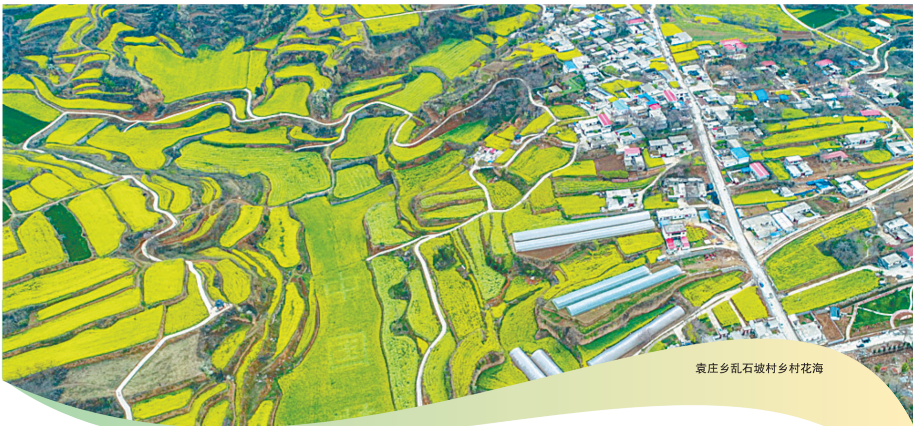
袁庄乡乱石坡村乡村花海