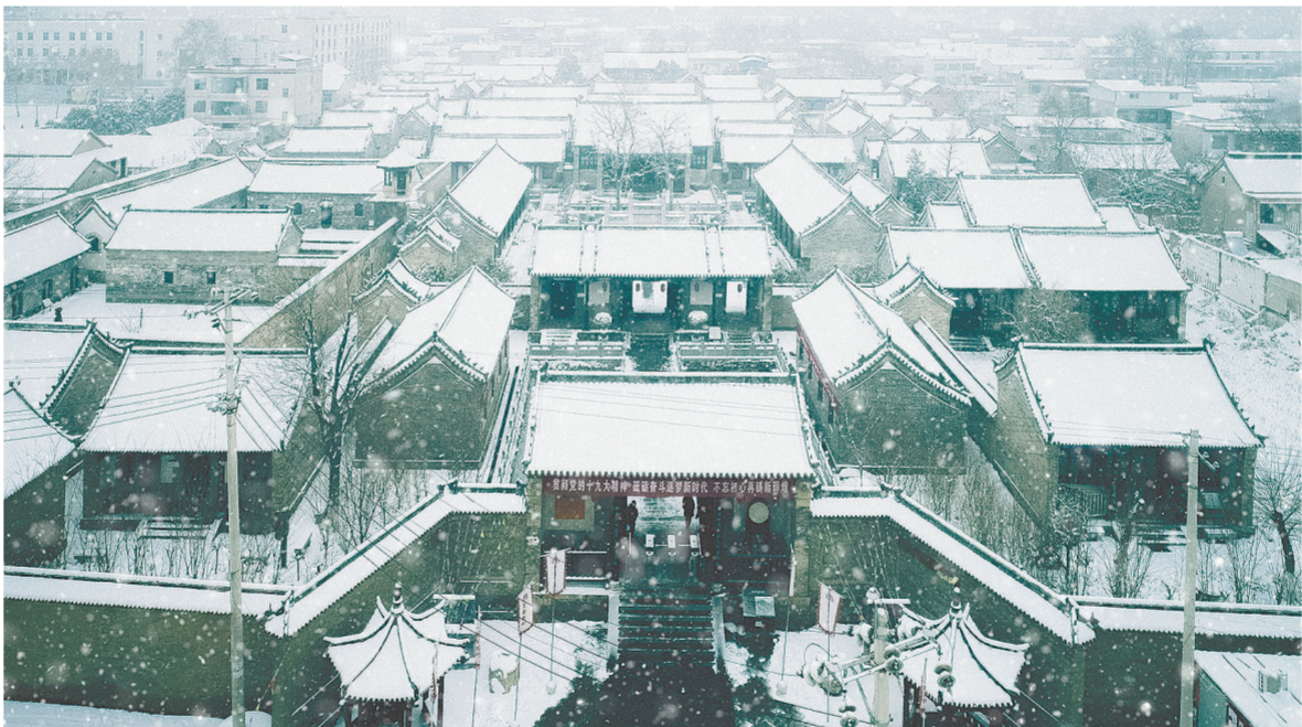
千年古街密县县衙