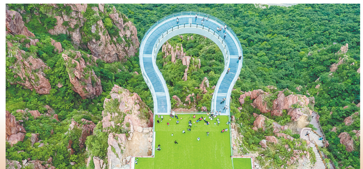
伏羲山红石林景区玻璃环廊