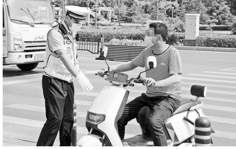
交警对未佩戴头盔的骑行者现场纠正劝导

郑州交警将在每日交通高峰期和平峰期,对各个路口安全头盔佩戴率进行巡查,对佩戴率低的路口路段,加派警力进行查处;加大重点路段的巡逻密度和频次,及时发现不戴头盔、不系安全带的交通违法行为,通过喊话提示劝导、现场纠正劝导等方式,最大限度扩大路段管控的覆盖面;多种方式线上线下宣传,广泛提醒骑行佩戴头盔、驾乘机动车系安全带对出行安全的重要性;与辖区各级文明单位建立联席制度,组织“红马甲”志愿者在早晚高峰期等时段参与文明交通秩序维护;在全市主要路口固定岗设立违法当事人学法义务执勤点,对未佩戴安全头盔的,第一次当场责令改正,不予处罚,登记录入当事人相关信息,第二次在违法路口打“小黄旗”进行义务执勤10分钟,第三次予以处罚。