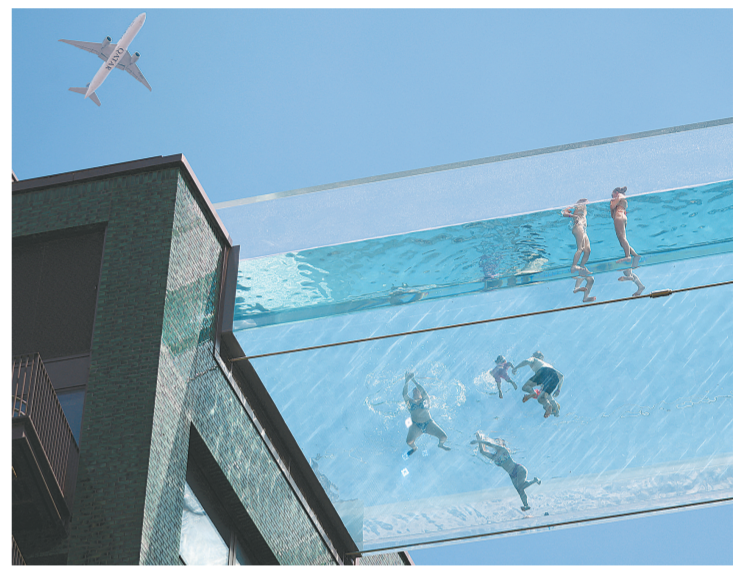
7月10日，人们在英国伦敦的“空中泳池”游泳。在伦敦南部的“使馆花园”公寓，两栋建筑之间架设着25米长的透明泳池，人们可以游泳穿梭其间。