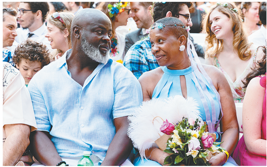
7月10日，人们在美国纽约参加集体婚礼。纽约市数百对新人当天参加了集体婚礼。受疫情影响，纽约市许多人的婚礼曾被推迟或取消。