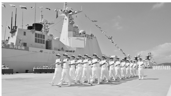
8月1日，北部战区海军某驱逐舰支队举办队列会操。