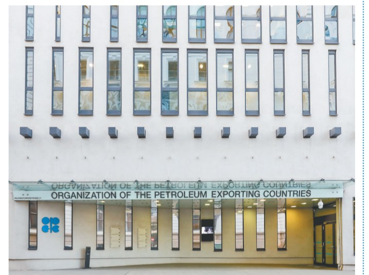
这是2022年3月3日在奥地利维也纳拍摄的石油输出国组织(欧佩克)总部。

新华社维也纳8月3日电(记者 刘昕宇)石油输出国组织(欧佩克)与非欧佩克产油国3日以视频方式举行第31次部长级会议，决定今年9月小幅增产，将该月的月度产量日均上调10万桶。