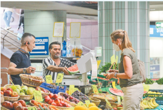
8月2日，顾客在德国法兰克福一家摊位前购买水果。

今年以来，受新冠疫情、地缘冲突、能源和供应链危机等多重因素叠加影响，德国能源与食品价格持续飙升，通胀率居高不下，民众不得不支付更高生活成本，咽下通胀高企的苦果。