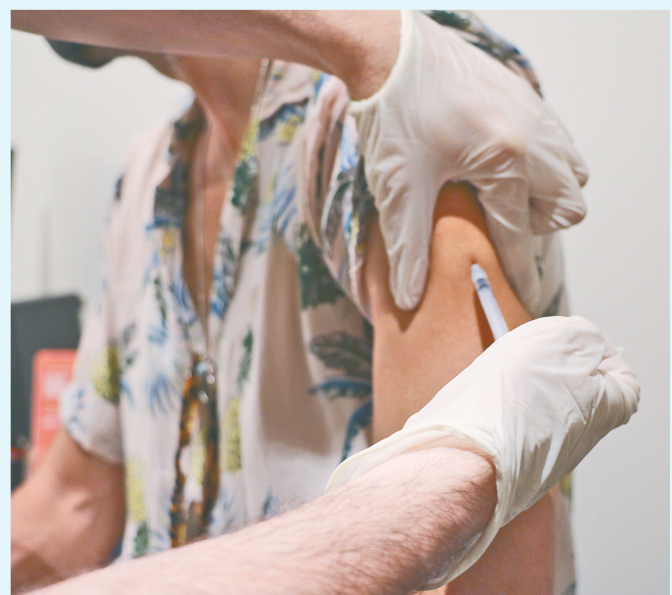
8月3日，一名男子在西班牙巴塞罗那一家诊所内接种猴痘疫苗。

世界卫生组织7月23日宣布多国猴痘疫情构成“国际关注的突发公共卫生事件”。欧洲疾病预防控制中心和世卫组织欧洲区域办事处8月3日联合发布的统计数据显示，在本轮猴痘疫情较严重的欧洲地区，确诊病例已超过1.5万例。