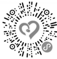
《郑州慈善 善爱绿城》慈善项目

答:可通过两种途径实现便捷捐赠。一是广大市民可通过腾讯公益平台搜索《郑州慈善 善爱绿城》慈善项目,在项目链接主页面最下方,点击“单笔捐款”,输入意愿捐赠金额,就能为我市乡村振兴助力;二是广大市民可通过手机扫描下方二维码或识别图片二维码,很便捷地参与此次活动。