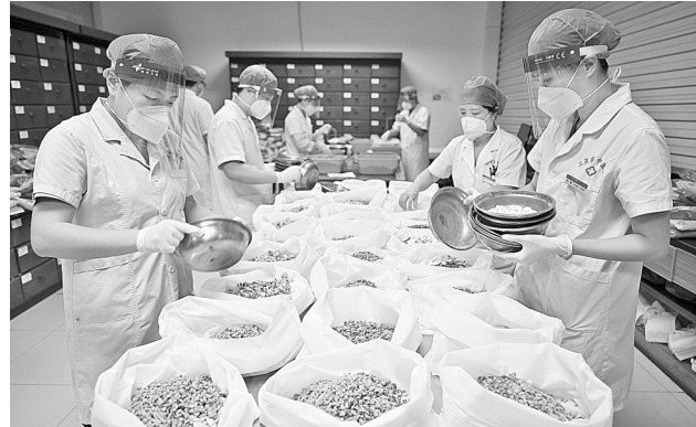
8月20日，三亚市中医院的药剂师在进行中药饮片调剂。记者从海南省新冠肺炎疫情防控工作指挥部了解到，海南本轮疫情发生以来，海南省12家方舱医院和3家定点医院全部应用了中药协定方，每日配送中药汤剂超过1万剂。