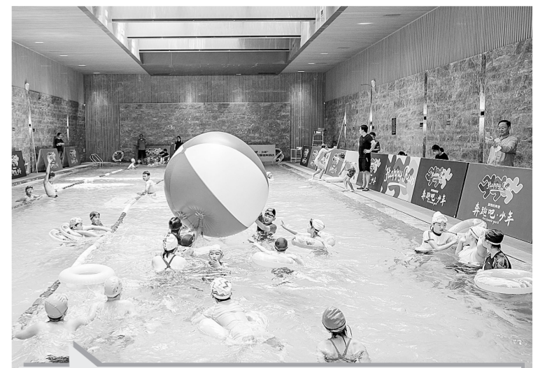
由省体育局、省教育厅、共青团河南省委主办的2022年河南省“奔跑吧·少年”儿童青少年主题健身活动走进市区系列赛近日在郑州举行,孩子们在趣味游泳比赛中缔结青春友谊,收获运动快乐。

据市文广旅局相关负责人介绍,卫星电视广播地面接收设施俗称“小耳朵”“卫星锅”“小锅盖”等。擅自安装和使用这些设备不仅涉嫌违法,同时具有很大的安全隐患。 据统计,截至目前,全市已出动专项检查执法人员620人次,检查商户400余家,宾馆、酒店和社区520余家,没收违法销售设备11套,拆除“非法小耳朵”60多套,发放宣传材料3000份,有效形成生产、流通、销售、安装、使用的全链条治理。