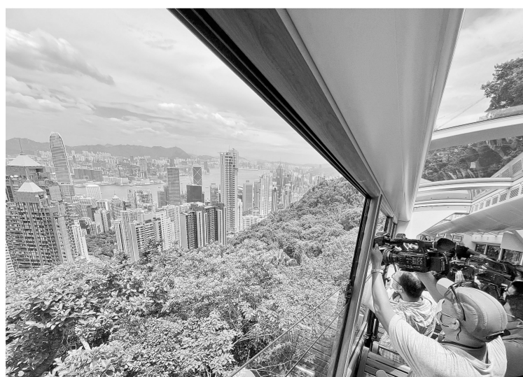
8月24日,媒体记者试乘香港第六代山顶缆车。

据新华社香港8月24日电(记者 陈珺盈)香港山顶缆车有限公司24日宣布,第六代山顶缆车将于8月27日11时正式投入运作。