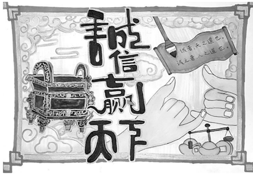
诚信赢天下 金水区黄河路第一小学 曹恩泽 辅导老师 吴济杨

2. 作品须注明“姓名+学校+班级”，并请辅导老师给予点评。特别提醒：请准备一张电子版生活照及150字左右的个人简历随投稿文章一起发送至上述电子邮箱。