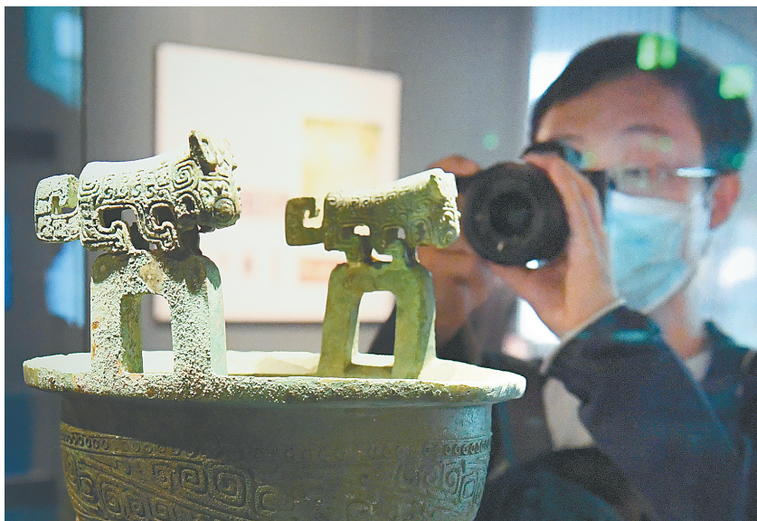
第九届“博博会”展览面积6万平方米,645家企业及博物馆参展,规模创历届之最

9月1日上午,因疫情而延期两年举行的第九届“博博会”在郑州国际会展中心开幕,主题为“新时代的博物