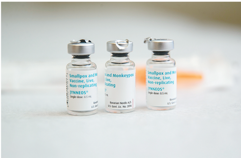
这是8月30日在美国亨廷顿拍摄的猴痘疫苗。

美国新冠疫情防控不力造成上百万人丧生，即便如此，美国决策者们似乎并没有从中吸取教训。近期猴痘疫情蔓延，美国累计感染病例超过2万例，成为全世界报告猴痘病例最多的国家。《华盛顿邮报》社论指出，美国在控制猴痘疫情上已经失败。