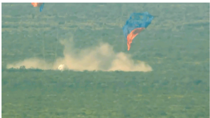
这张由蓝色起源公司提供的图片显示，9月12日，在美国得克萨斯州西部，太空舱打开降落伞落地。新华社发

新华社洛杉矶9月12日电(记者 谭晶晶)美国蓝色起源公司的“新谢泼德”飞行器12日进行不载人太空试飞，火箭在发射后出现故障并坠毁，没有造成人员伤亡。