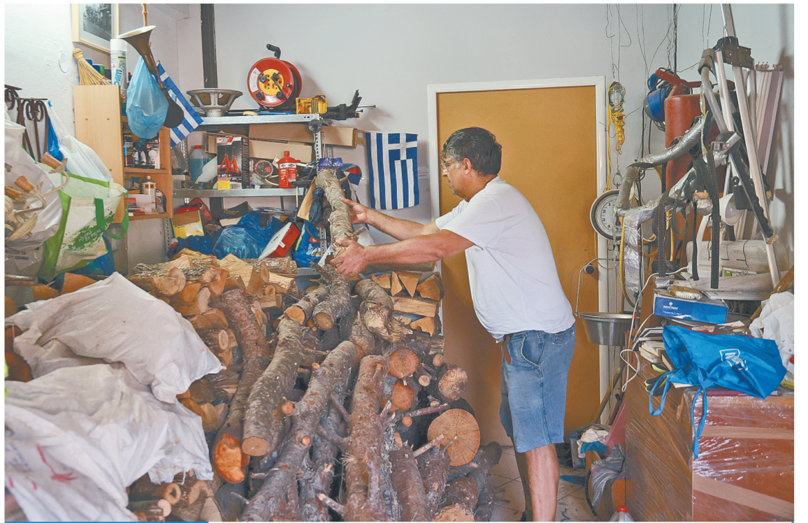
希腊雅典：拾柴备冬

9月12日，一名男子在希腊雅典的家中堆放柴火。雅典当地政府在市政公园内为民众提供免费柴火，以应对冬季的来临。