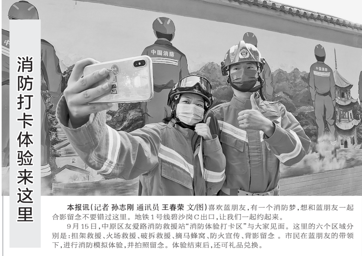
消防打卡体验来这里

本报讯(记者 杨丽萍 通讯员 王海霞)自开展“万人助万企”活动以来,惠济区长兴路街道积极为企业办实事、解难题,取得了显著成效,先后开展助企活动6场,组织大型政策宣讲3场,走访企业上百次,为企业解决资金周转高达千万元。 其中在走访企业郑州方合圆贸易有限公司时,了解到企业目前因资金周转问题,急需大额资金支持,希望政府能给予资金上的帮助和支持。了解到企业的实际需求,该街道结合企业实际情况向企业介绍“信易贷”郑州中小微企业金融服务平台。“信易贷”是互联网贷款的一种,它以贷款利率低、放款速度快、手续简便等优势,搭建线上平台+线下服务模式,有利于更便捷地满足企业和居民合理的融资需求,支持实体经济发展。为此,街道邀请农业银行的老师指导企业注册平台,并申请融资贷款,以最快捷、最高效的速度,完成企业资金申报,审批程序。使企业顺利地实现生产、加工、仓储为一体的质量控制产业链,为企业稳步发展提供资金支持。 “万人助万企”活动开展以来,长兴路街道甘当政策宣传员、活动联络员、企业服务员,将持续在辖区内开各种惠企助企宣传活动,把惠企政策传播到企业当中去,让人人了解政策、人人掌握政策,做到政策为人民服务,企业受益其中。