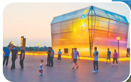
荥泽古城文化公园美景

古荥镇作为惠济区辖区面积最大的农村乡镇，在国家黄河战略实施的核心示范区起步区建设中，始终牢记习近平总书记嘱托，始终以“功成不必在我”的精神境界和“功成必定有我”的历史担当，一茬接着一茬干，一棒接着一棒跑，切实干出了成效，跑出了高质量发展的加速度，努力在“保护母亲河、打造幸福河”中展现新作为、新担当。