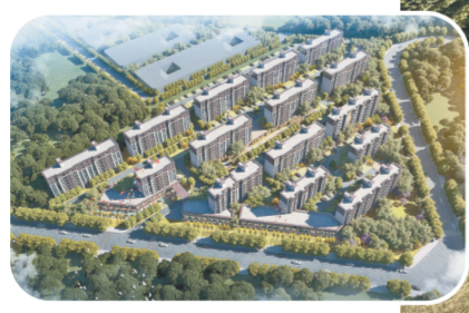
黄河桥村地质灾害搬迁安置项目效果图