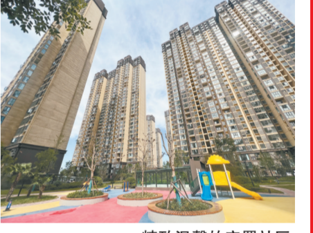
精致温馨的安置社区