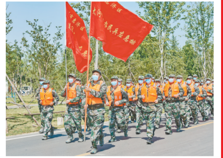
应急演练中的大河民兵