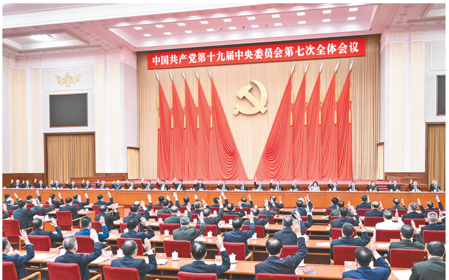
中国共产党第十九届中央委员会第七次全体会议，于2022年10月9日至12日在北京举行。中央政治局主持会议。