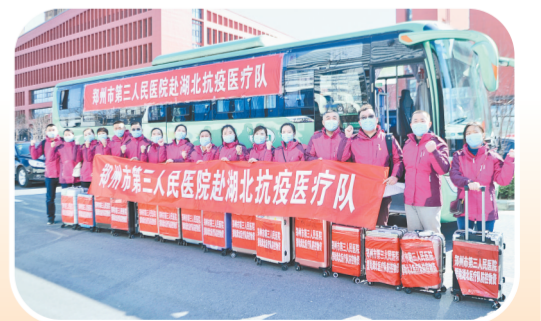
郑州市三院赴湖北抗疫医疗队

“作为慈善医院，就要勇担社会责任，为一方百姓谋福祉。”这是百年三院的血脉传承。栉风沐雨117年，“性命相托、责比天大”这八个大字早已写在了百年郑州市三院的发展卷轴上，也深深铭刻在一代代郑州三院人的心中。