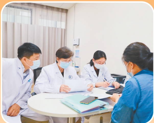
李兰娟院士在会诊中