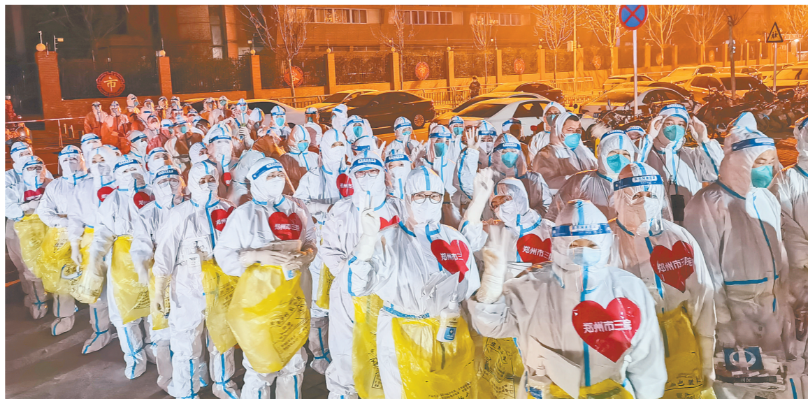
白衣执甲，保障核酸检测