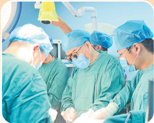
郑树森院士在手术中