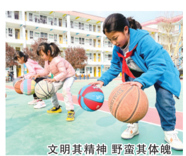
文明其精神 野蛮其体魄