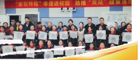
金石传拓 非遗进校园 助推“双减”政策落地

课后延时 减负提质 “双减”是为了孩子成长的加质，素质的加强，快乐的加倍，学校既要做好减轻学生过重课业负担的“减法”，又要做好促进学生全面发展、个性发展的“加法”，为此，杏园路第三小学认真制定课后延时服务工作方案，采用“2+1”模式，即“体育锻炼+作业辅导+培养个性发展社团活动”。