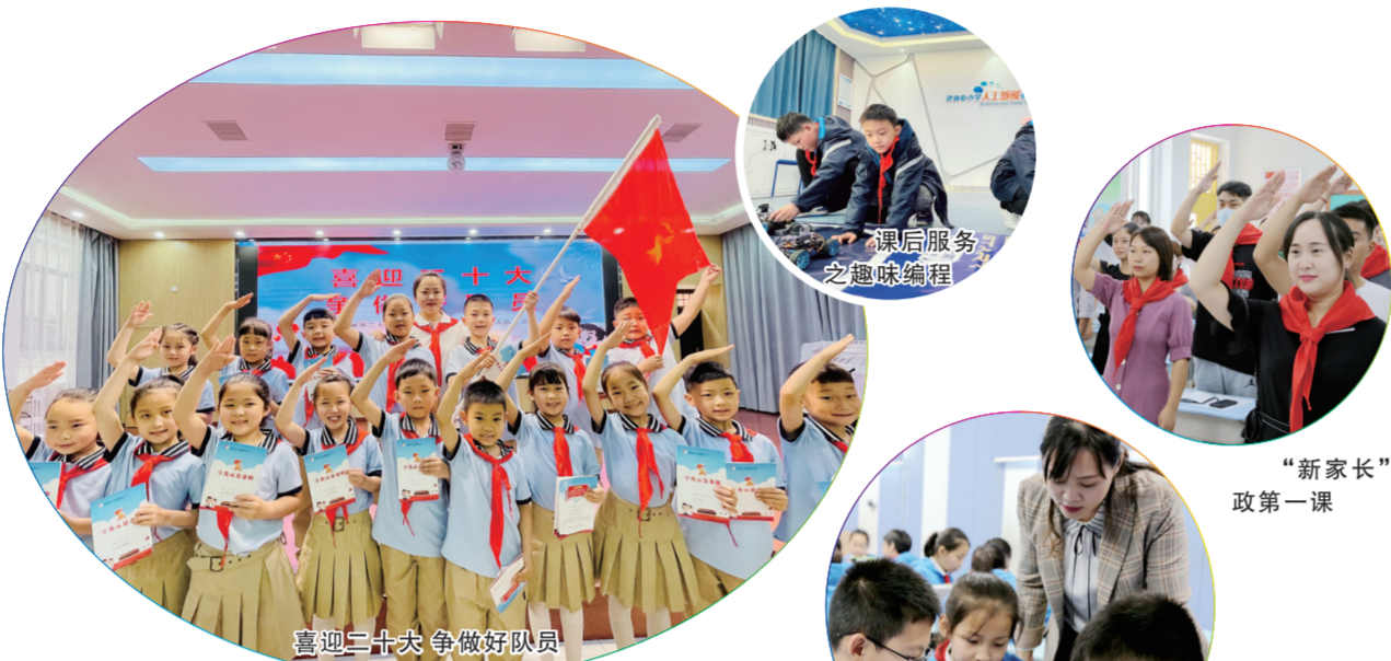
喜迎二十大 争做好队员

学校以“回归教育的原点”为办学理念，以“为了每一个”为办学愿景，倡导“做、读、玩”的教育生活方式，整合育人元素，完善育人体系，“五育融合”，培养了一批批“能行、善知、会创新”的建新学子。