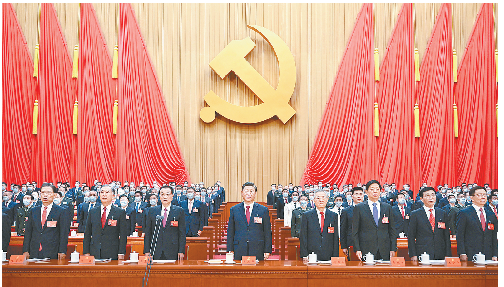
10月16日，中国共产党第二十次全国代表大会在北京人民大会堂开幕。这是习近平、李克强、栗战书、汪洋、王沪宁、赵乐际、韩正、胡锦涛在主席台上。

新华社北京10月16日电 凝心聚力擘画复兴新蓝图，团结奋进创造历史新伟业。举世瞩目的中国共产党第二十次全国代表大会16日上午在人民大会堂开幕。