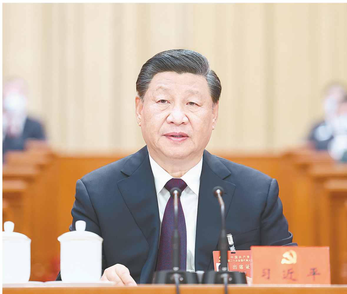
10月22日,中国共产党第二十次全国代表大会在北京人民大会堂胜利闭幕。习近平同志主持大会。

习近平强调,中国共产党走过了百年奋斗历程,又踏上了新的赶考之路。一百年来,党团结带领全国各族人民取得了新民主主义革命、社会主义革命和建设、改革开放和社会主义现代化建设的伟大胜利,开创了中国特色社会主义新时代。百年成就无比辉煌,百年大党风华正茂。我们完全有信心有能力在新时代新征程创造令世人刮目相看的新的更大奇迹。全党要紧密团结在党中央周围,高举中国特色社会主义伟大旗帜,坚定历史自信,增强历史主动,敢于斗争、敢于胜利,埋头苦干、锐意进取,团结带领全国各族人民为实现党的二十大确定的目标任务而奋斗