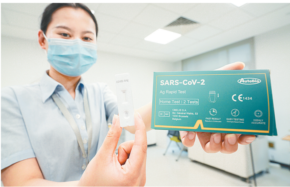
工作人员展示安图生物的产品

10月14日、10月17日、10月18日,豫股安图生物连续三个交易日涨停,股价创出一年多以来的新高点。地处郑州经开区的郑州安图生物工程股份有限公司,专注于体外诊断试剂和仪器的研发、制造、整合及服务,产品涵盖免疫、微生物、生化、分子、凝血等检测领域,能够为医学实验室提供全面的产品解决方案和整体服务,产品在全国三级医院覆盖率超过64%,出口80多个国家和地区,企业综合实力居国内同行业前列。