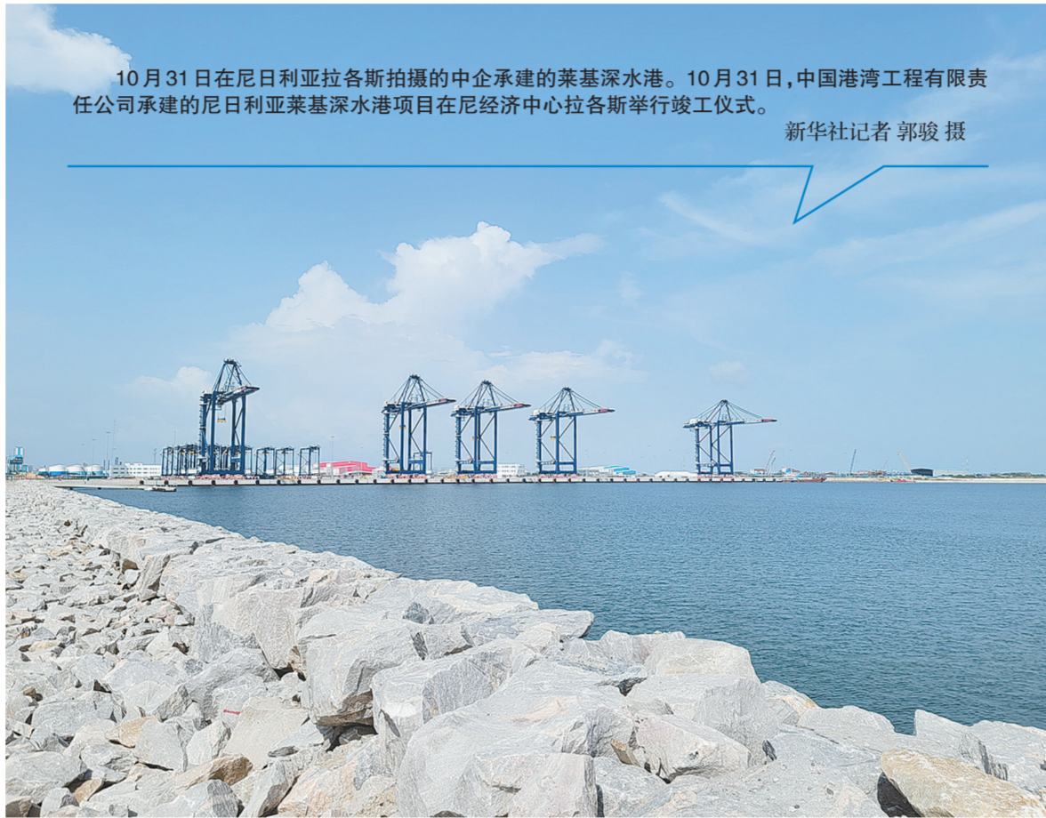
10月31日在尼日利亚拉各斯拍摄的中企承建的莱基深水港。10月31日,中国港湾工程有限公司承建的尼日利亚莱基深水港项目在尼经济中心拉各斯举行竣工仪式。

苏联解体后,阿塞拜疆和亚美尼亚因纳卡地区归属问题爆发战争。1994年,双方就全面停火达成协议,但两国一直因纳卡问题处于敌对状态,武装冲突时有发生。2020年9月,两国因纳卡问题爆发新一轮冲突。同年11月9日,俄罗斯、阿塞拜疆和亚美尼亚三国领导人签署声明,宣布纳卡地区从莫斯科时间10日零时起全面停火。根据该声明,俄罗斯在纳卡地区部署维和人员。