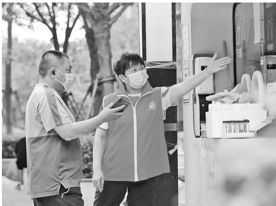
身着红马甲的志愿者为居民提供服务

11月11日凌晨1点,许多人都已进入梦乡,但在二七区福华街街道京广家园南社区的办事大厅里依然灯火通明,一群身着红马甲的志愿者正在忙碌,为5个小时后将进行的新一轮核酸检测做准备。