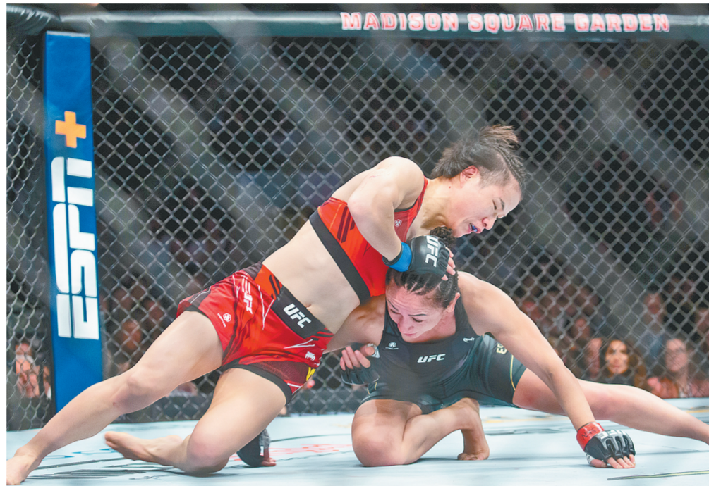
11月12日,中国选手张伟丽(左)与美国选手卡拉·埃斯帕扎在比赛中。当日,在美国纽约举行的终极格斗冠军赛中,中国选手张伟丽战胜女子草量级现任冠军卡拉·埃斯帕扎,重夺金腰带。

本报讯(记者 秦华)11月12日晚,第35届中国电影金鸡奖颁奖典礼暨2022年中国金鸡百花电影节闭幕式在厦门举行,揭晓了本届金鸡奖各奖项。 本届金鸡奖共揭晓了20个奖项。备受关注的最佳故事片花落《长津湖》,评委会特别授予影片《我和我的父辈》。陈凯歌、徐克、林超贤凭借《长津湖》共同摘得最佳导演奖,刘江江凭借《人生大事》摘得最佳导演处女作奖。今年共有5部影片入围最佳外语片奖项提名,最终《漫漫寻子路》收获该奖。《1950他们正年轻》获最佳纪录/科教片奖,《熊出没·重返地球》获最佳美术片奖,《再见土拨鼠》获最佳儿童片奖,《敦煌女儿》获最佳戏曲片奖。 演员类奖项角逐激烈,朱一龙、奚美娟分别凭借《人生大事》中饰演的莫三妹、《妈妈!》中饰演的冯济真获得最佳男女主角,辛柏青、齐溪分别凭借《漫长的告白》中饰演的立春、《奇迹·笨小孩》中饰演汪春梅获得最佳男、女配角。 金鸡奖同样关注幕后电影人,先后颁出了最佳录音、剪辑、美术、音乐、摄影等奖项,最佳编剧奖颁给《爱情神话》编剧邵艺辉。终身成就电影艺术家荣誉授予了王玉梅、黄蜀芹、王好为,三位电影人在漫长的电影之路上奉献了一部部脍炙人口的经典作品。