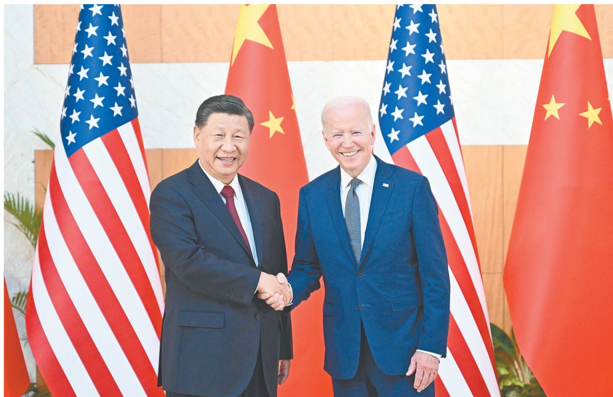
当地时间11月14日下午，国家主席习近平在巴厘岛同美国总统拜登举行会晤。

新华社印度尼西亚巴厘岛11月14日电(记者白林 倪四义 刘华)当地时间11月14日下午，国家主席习近平在印度尼西亚巴厘岛同美国总统拜登举行会晤。两国元首就中美关系中的战略性问题以及重大全球和地区问题坦诚深入交换了看法。