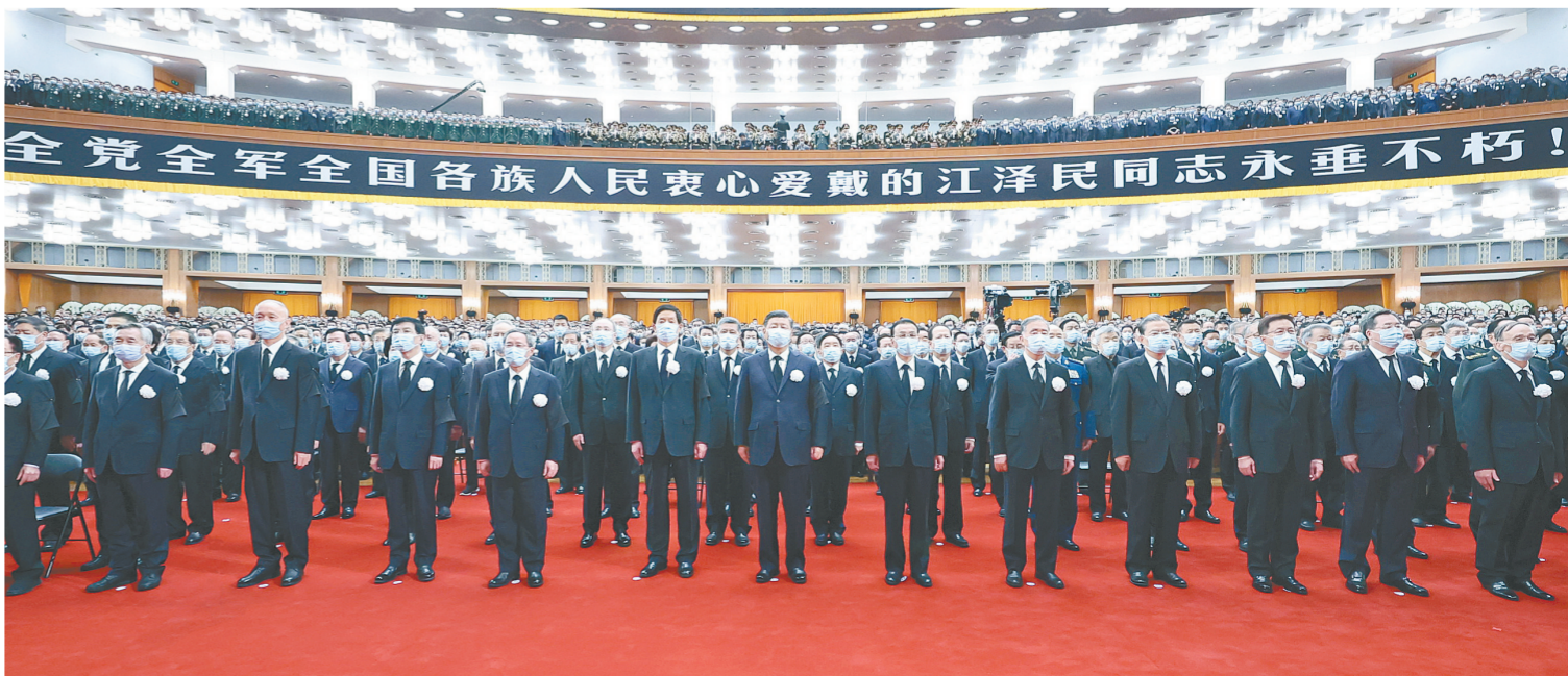
12月6日，中共中央、全国人大常委会、国务院、全国政协、中央军委在北京人民大会堂隆重举行江泽民同志追悼大会。习近平、李克强、栗战书、汪洋、李强、赵乐际、王沪宁、韩正、蔡奇、丁薛祥、李希、王岐山等参加大会。