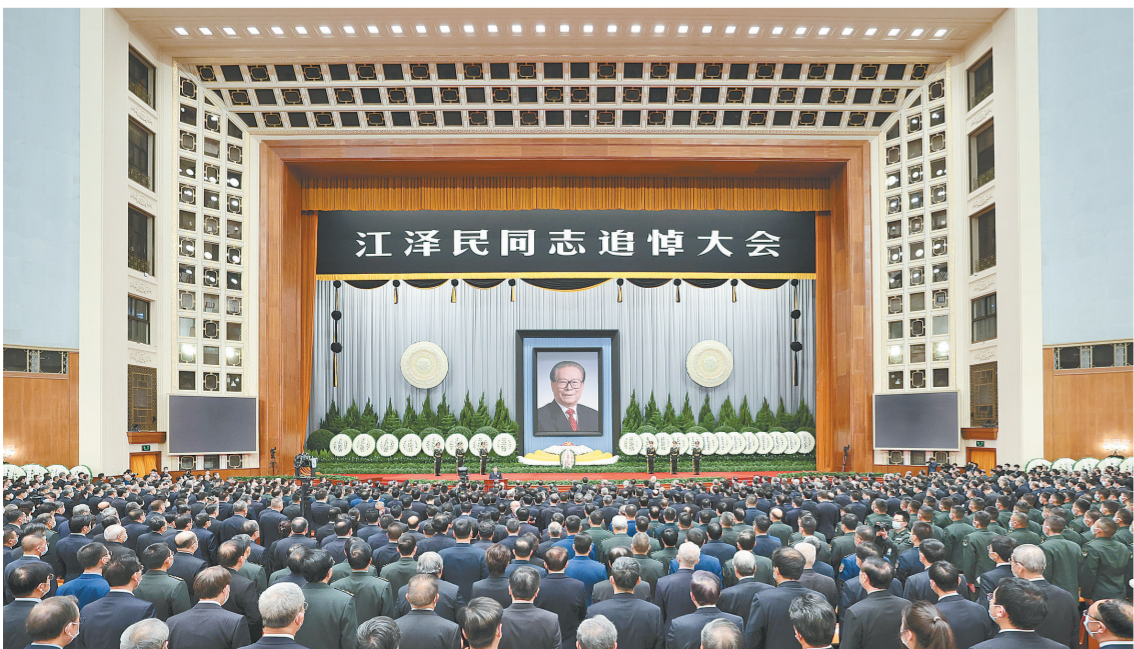
12月6日，中共中央、全国人大常委会、国务院、全国政协、中央军委在北京人民大会堂隆重举行江泽民同志追悼大会。