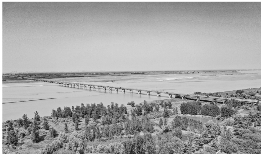
我市稳步推进黄河流域生态保护和高质量发展核心示范区、先行区建设,围绕生态修复和环境治理,大力实施生态保护修复工程,沿黄生态持续向好。图为花园口黄河大桥西侧的河滩里绿树成林,芳草萋萋,景色秀丽(资料图片)。

本报讯(郑报全媒体记者 董艳竹)昨日,市十五届人大常委会第四十次会议听取了关于《郑州建设黄河流域生态保护和高质量发展核心示范区总体发展规划(2020—2035年)》和《郑州建设黄河流域生态保护和高质量发展核心示范区起步区建设方案(2020—2035年)》落实情况的报告。报告提到,郑州黄河流域生态保护和高质量发展核心示范区、起步区建设各项工作正在稳步推进,新一轮三年行动计划(2023—2025年)编制工作即将启动。