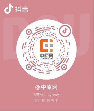
扫码关注中原网官方抖音号

中原网官方抖音号直播首秀将于12月10日上午10点在郑州银基国际旅游度假区正式开启,接下来,将有好想你、方特、方中山、豆状元、大卫城等众多商家参与到直播带货活动中,为中原网粉丝带来吃喝玩乐等方面的多重福利。