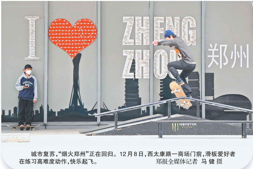
城市复苏,“烟火郑州”正在回归。12月8日,西太康路一商场门前,滑板爱好者在练习高难度动作,快乐起飞。

据了解,郑州市公交第三运营公司将在高峰期增加发车,特别是在6:30-8:00、16:00-17:30投放充足运力,对于市民出行需求量较大的906路、904路、84路、S162路、291路、298路、S139路、S117路、S122路、315路、B58路、269路等线路的平均高峰发车间隔缩短6-8分钟,尽力缩短市民候车时间。