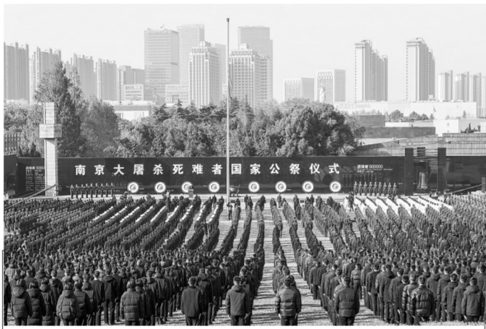
这是12月13日拍摄的南京大屠杀死难者国家公祭仪式现场。