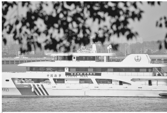
12月13日，船只在侵华日军南京大屠杀中山码头遇难同胞纪念碑附近江面参加悼念活动。