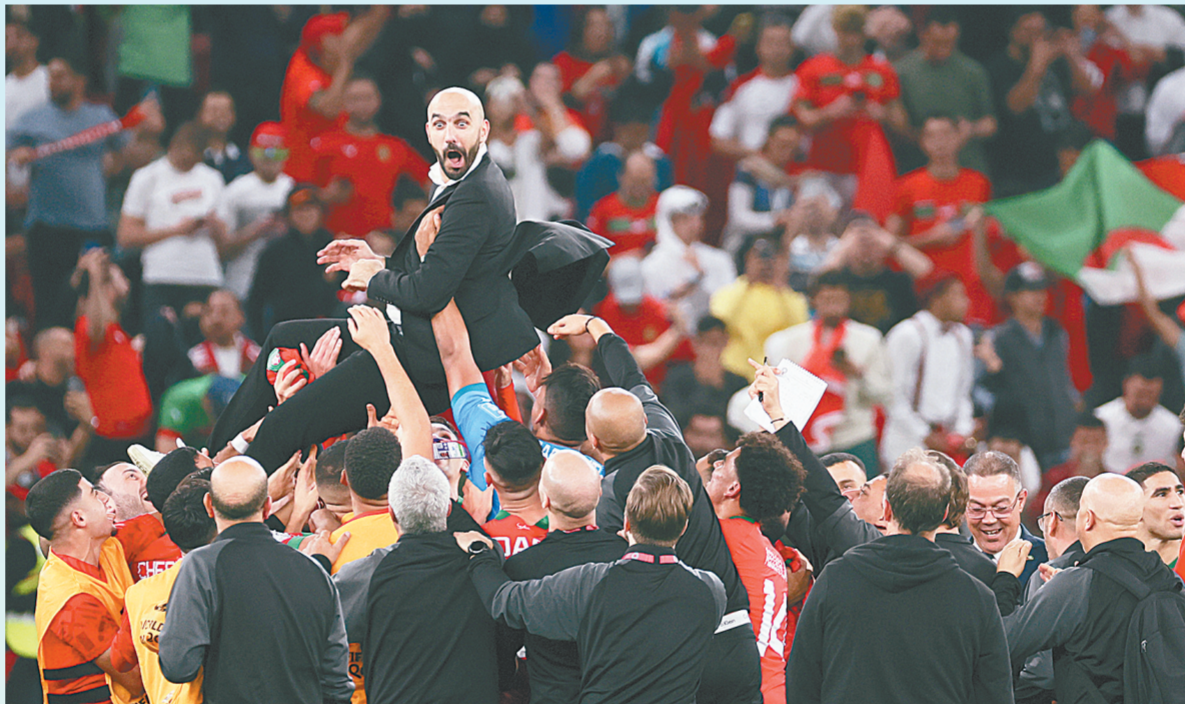
摩洛哥队成员在八强赛后抛起主教练瓦利德·雷格拉吉庆祝晋级半决赛

“非洲的历史！令人惊叹的成就！”在摩洛哥队击败葡萄牙队成为世界杯历史上首支进军四强的非洲球队之后，非洲足联在社交媒体上欢呼。这的确是值得大书特书的成就，毕竟这是非洲球队自1934年首次参加世界杯、历经88年努力后，在世界杯史册中写下的最华丽一笔。