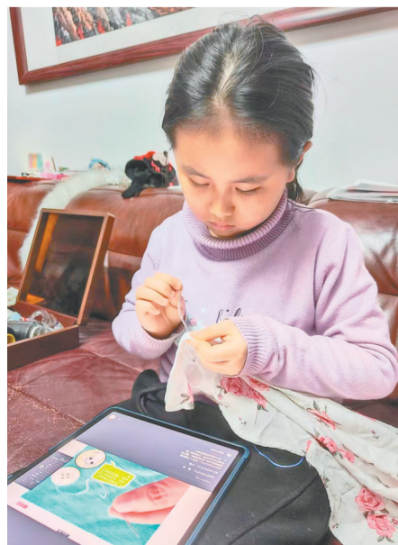
沙口路小学学生动手缝制纽扣