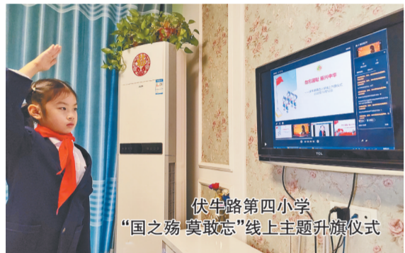
伏牛路第四小学“国之殇 莫敢忘”线上主题升旗仪式