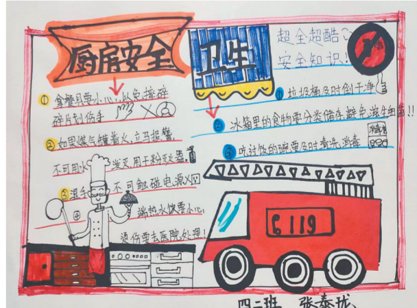
航空港区领航学校南校区学生绘制厨房安全手抄报

二七区长江路第二小学也精心设计了别具一格的劳动实践活动,“认识各种蔬菜”“我和蔬菜交朋友”等创意劳动实践,深受孩子们的欢迎。学生在活动中观察、思考、动手,绘制蔬菜“名片”,认识不同蔬菜的营养价值,养成爱吃蔬菜、不偏食的习惯。该校希望通过一系列的实践活动,弘扬勤俭、奋斗、创新、奉献的劳动精神,提升学生自理自立生活能力,努力培养德智体美劳全面发展的新时代好少年。