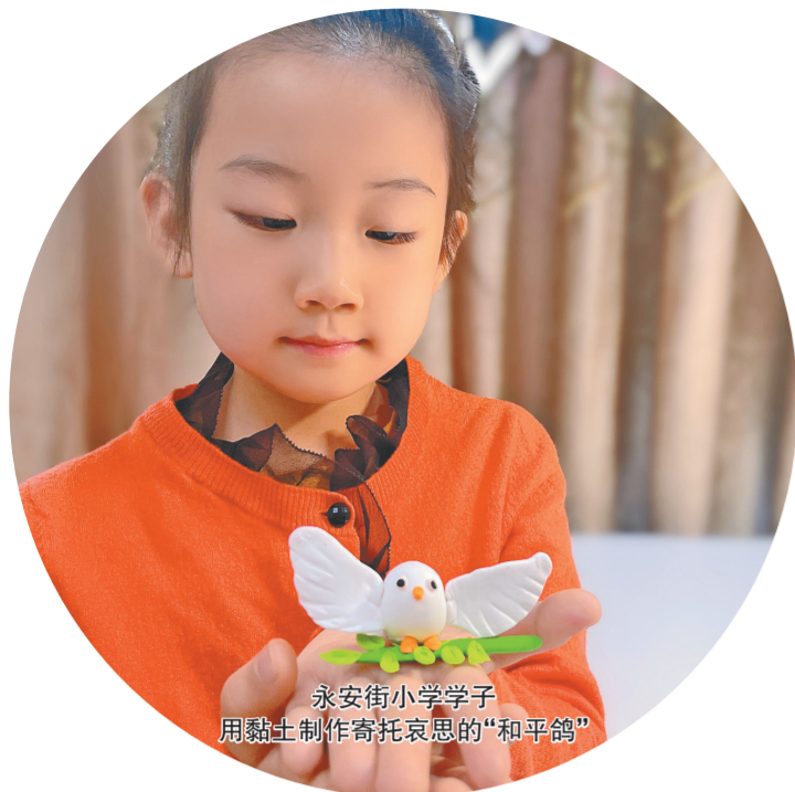
永安街小学学子用黏土制作寄托哀思的“和平鸽”