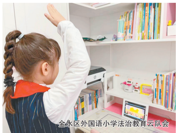
金水区外国语小学法治教育云队会