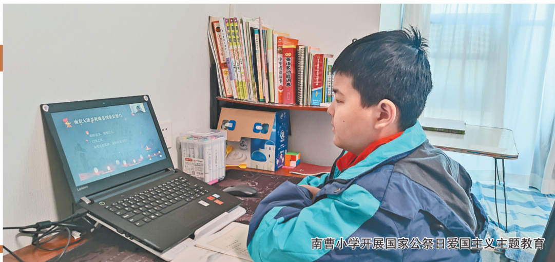
南曹小学开展国家公祭日爱国主义主题教育

近期,我市多所学校持续推进红色教育与学生思想政治教育的深度融合,深挖红色教育元素,创新红色德育模式,开展了国旗下演讲、主题班会、讲红色故事、国家公祭日主题教育等多种多样的红色教育实践活动,让学生在红色教育“课堂”里汲取精神养分,用一个个耀眼的红色火炬,指引莘莘学子踔厉奋发、勇毅前行,成长为有理想、有本领、有担当的时代新人。