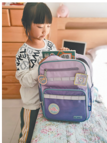
丰产路小学学生整理书包培养好习惯