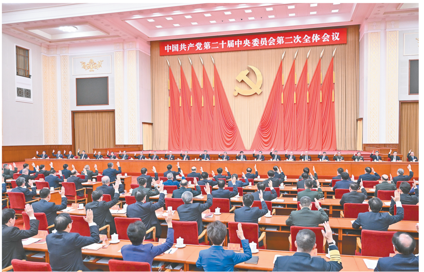
中国共产党第二十届中央委员会第二次全体会议,于2023年2月26日至28日在北京举行。中央政治局主持会议。新华社记者 燕雁 摄