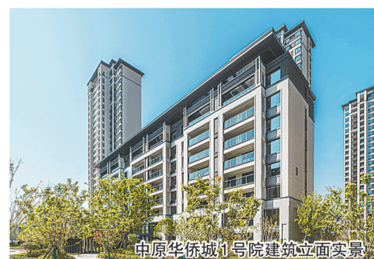
中原华侨城1号院建筑立面实景图