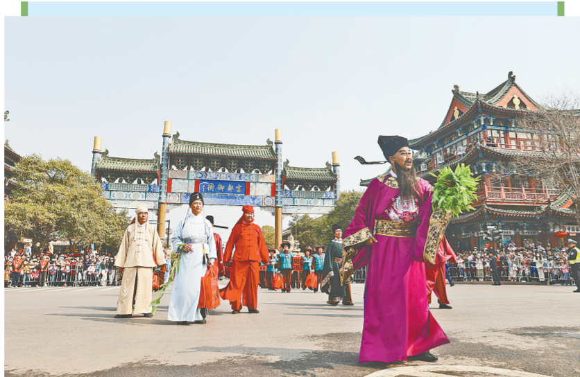
4月2日中国(开封)清明文化节“来趣宋潮”踏青大巡游活动举行。万客咸至,万人空巷,文旅经贸大餐分外香甜。