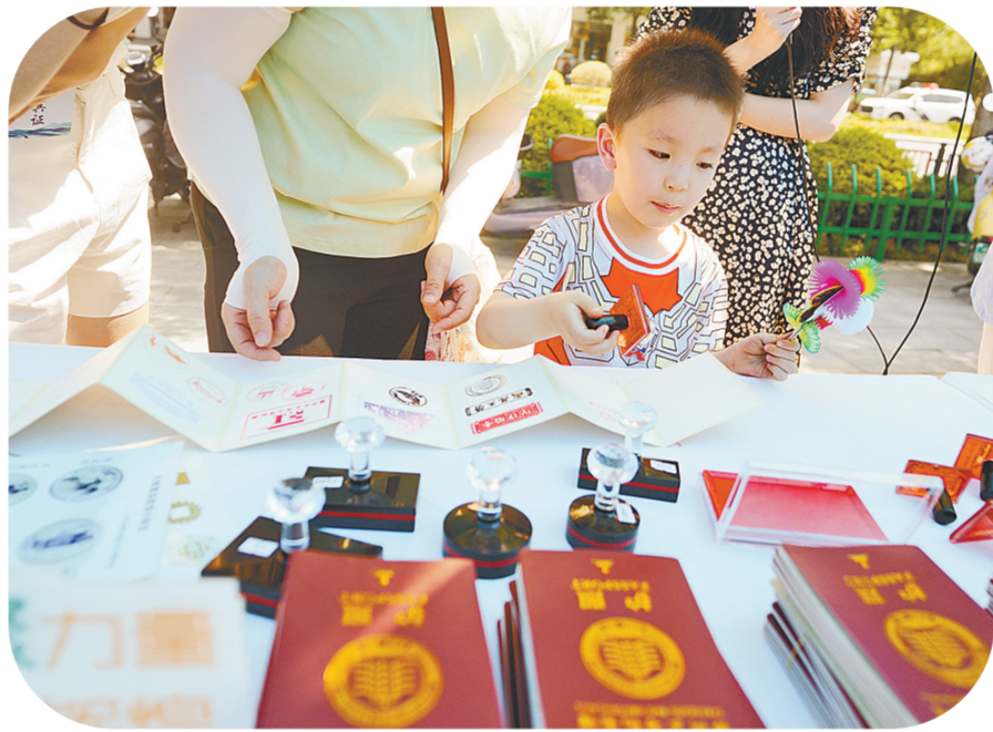
博物馆推出的旅游打卡“护照”趣味横生

在郑州二七纪念馆展台,一位年轻妈妈正带着6岁儿子在“博物馆通关护照”上认真盖章。翻看厚厚的“护照本”,只见上面已经盖了十几个不同造型的红色印章。“今天是周六,又恰逢文化和自然遗产