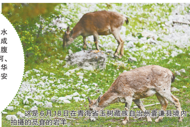
这是6月18日在青海省玉树藏族自治州囊谦县境内拍摄的觅食的岩羊。