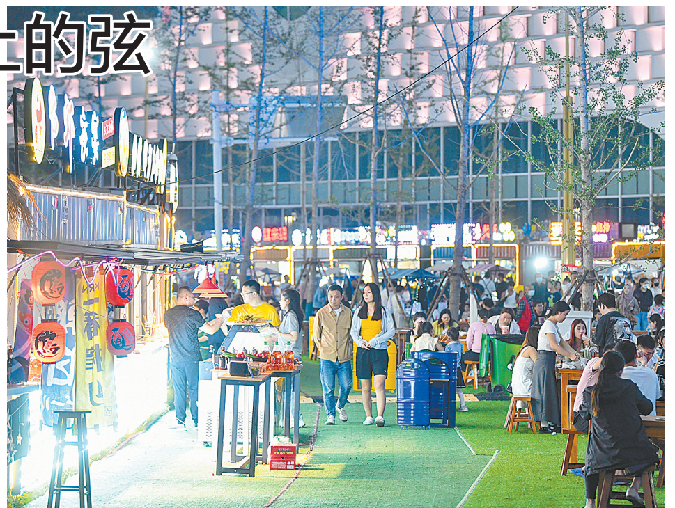
郑州CCD新青年音乐市集霓虹闪烁,游人如织