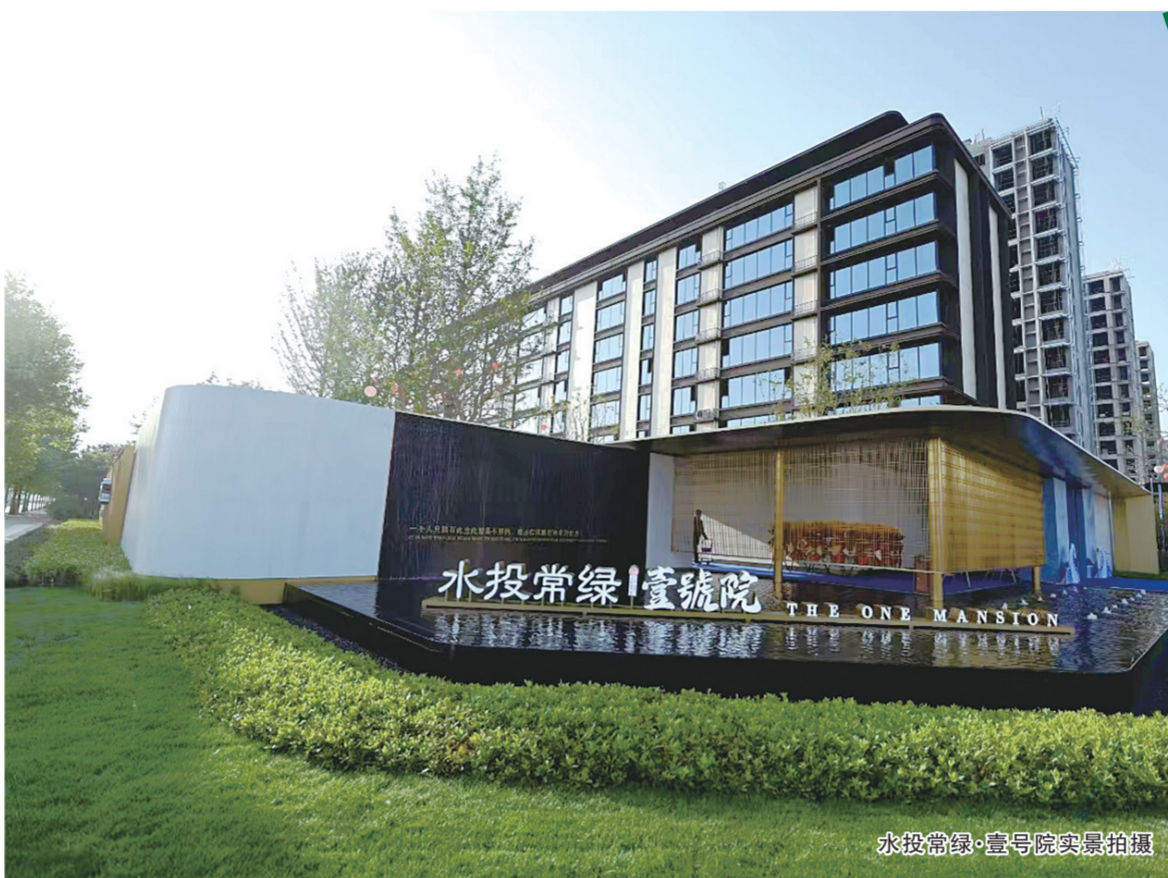
水投常绿·壹号院实景拍摄