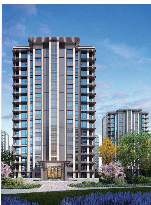
水投常绿·壹号院效果图

强强联合筑精品。由河南水投集团和河南常绿集团联合投资开发的水投常绿·壹号院，以1+1>2的品牌效应成就郑州楼市的一抹亮色，责任与情怀相映，实力与专业相融，在当前纷繁复杂的市场环境中，致力于交出超越期待、令人满意的答卷。