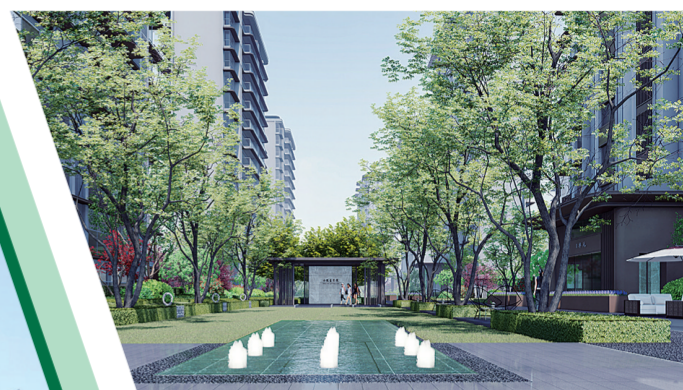
水投常绿·壹号院园区效果图