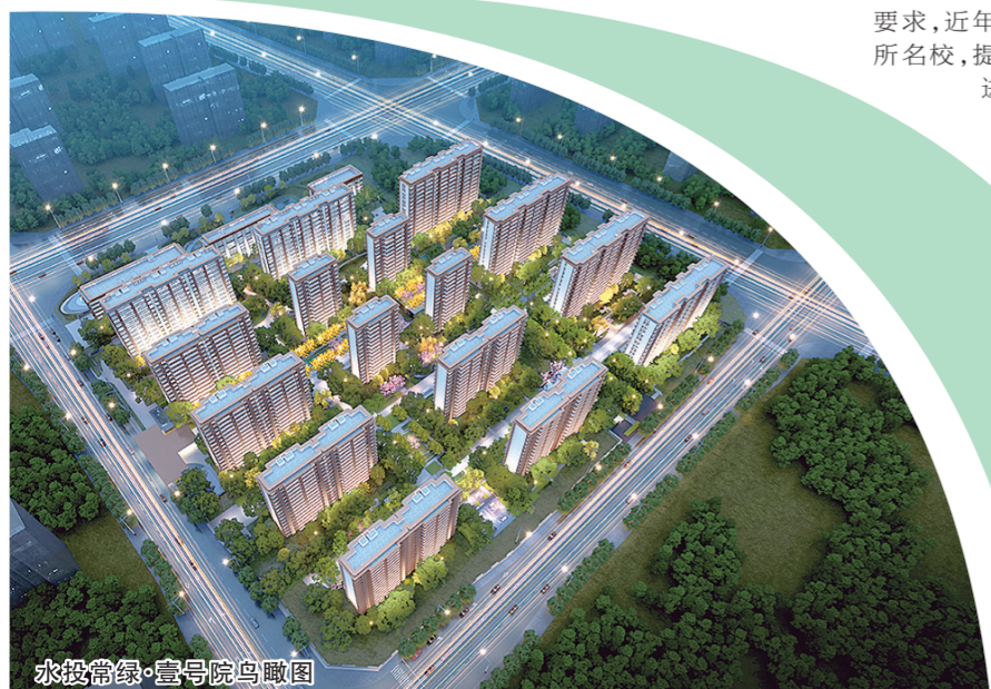
水投常绿·壹号院鸟瞰图