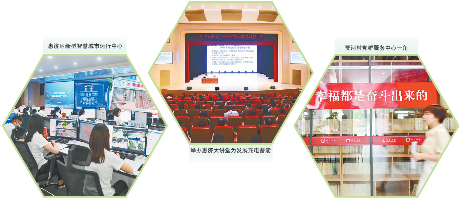
惠济区新型智慧城市运行中心

今年以来，惠济区以“开局就是决战，起步就要冲刺”的精神状态，贯彻落实“稳经济、促发展”一揽子政策，滚动推进“三个一批”项目，扎实开展“万人助万企”活动，全力以赴拼经济，铆足干劲促发展，奋力在全市经济社会发展大局中展现惠济新担当新作为。