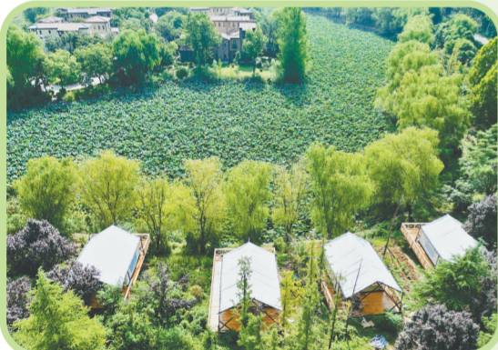
“重体验”推进文旅融合