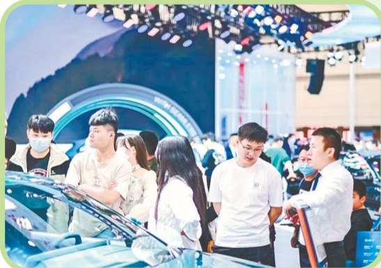
多措并举拉动消费升级