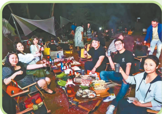
“夜经济”激发城市潜能

能，陆续推出黄河大集、星空露营季等活动，加速市场回暖。随着第四届“醉美·夜惠济”消费季系列活动的陆续启动，惠济区开展了“醉美·夜惠济”畅游黄河南岸系列主题活动，其中以“夜游惠济 乐享生活”为主题的文旅促消费活动，重点围绕端午、七夕节、暑期等重点节日，鼓励辖区A级景区、露营地、特色街区等旅游目的地推出形式多样的文旅促消费活动。此外，惠济区还在图书馆、郑品书舍等公共文化服务场所开展“醉美·夜惠济”文艺赏析月活动，挖掘消费潜力、提振市场信心，推动文旅融合，让市民游客感受惠济山水之美、人文之胜、休闲之魅。